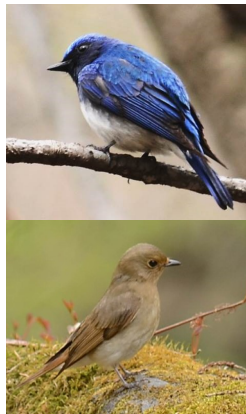
写真1. オオルリのオス(上)とメス。

オス成鳥は頭部から背まで体上面は光沢のある青色。翼は全体的に青く見えるが、開いた時に見える初列風切と次列風切の内弁は黒色。顔から胸および脇にかけて黒色で、腹部から下尾筒にかけて白色。尾羽は全体的に青色だが外側尾羽の基部に白斑がある。オスの青い羽は、濃い青から明るいコバルトブルーまで個体差がある。オス幼鳥はメス成鳥と似て茶色を帯びるが、翼や背から尾羽はオス成鳥と似て青味を帯びる。メスは全体的にオリーブ色がかった茶色。メスの腹部は白色で、胸は明るい茶色だが、その境界はオスのように明瞭ではない。