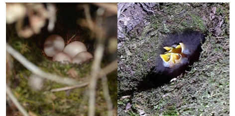
写真3. オオルリの卵(左)と巣内ヒナ。

一腹卵数は3~5卵(主に4~5卵)、卵には斑紋はなく白色または褐白色、長径は19.0~22.3mm, 短径は14.5~16.8mm, 重量は1.5~3g (清棲1978)。軽井沢では一腹卵数が4~5卵で、1シーズンの中で一回目の繁殖時には5卵、2回目繁殖もしくはやり直し繁殖の時には4卵の場合が多かった(徐 2016)。