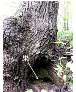
写真2. コケ類を主な材料として木の根元に作られていた巣。

営巣場所として、日陰で湿気のある沢沿いの斜面を好む。巣は木の根元にてきた隙間、薄暗い木の根元、岩壁などの屋根がある自然構造物、さらには建造物の屋根の下に巣を作る場合もある。巣作りはメスだけがを行い、巣材には主にコケ類を用いて、落ち葉や根を混ぜてお椀型の巣を作る(中村・中村 1995)。巣の大きさは外径8~14cm, 内径6~7.5cmで、深さ3.5~5cm, 高さ5~12cm(清棲 1978)。軽井沢の森では、哺乳類の捕食者が簡単には接近できないような急斜面、コケ類の生える湿った岩崖、崩れやすい土崖など、滑りやすい斜面に巣を造る場合が多かった(徐 2016)。